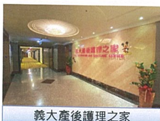
義大產後護理之家