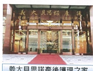
義大貝思諾產後護理之家