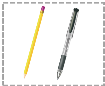
黑色 2B 軟心鉛筆、 黑色墨水的筆